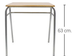
PUPITRE CLASS TIPO 3 Cód: AR63