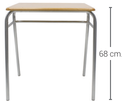
PUPITRE CLASS TIPO 4 Cód: AR62