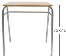
PUPITRE CLASS Tipo 5 Cód: AR61